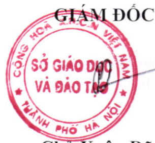
Chữ Xuân Dũng